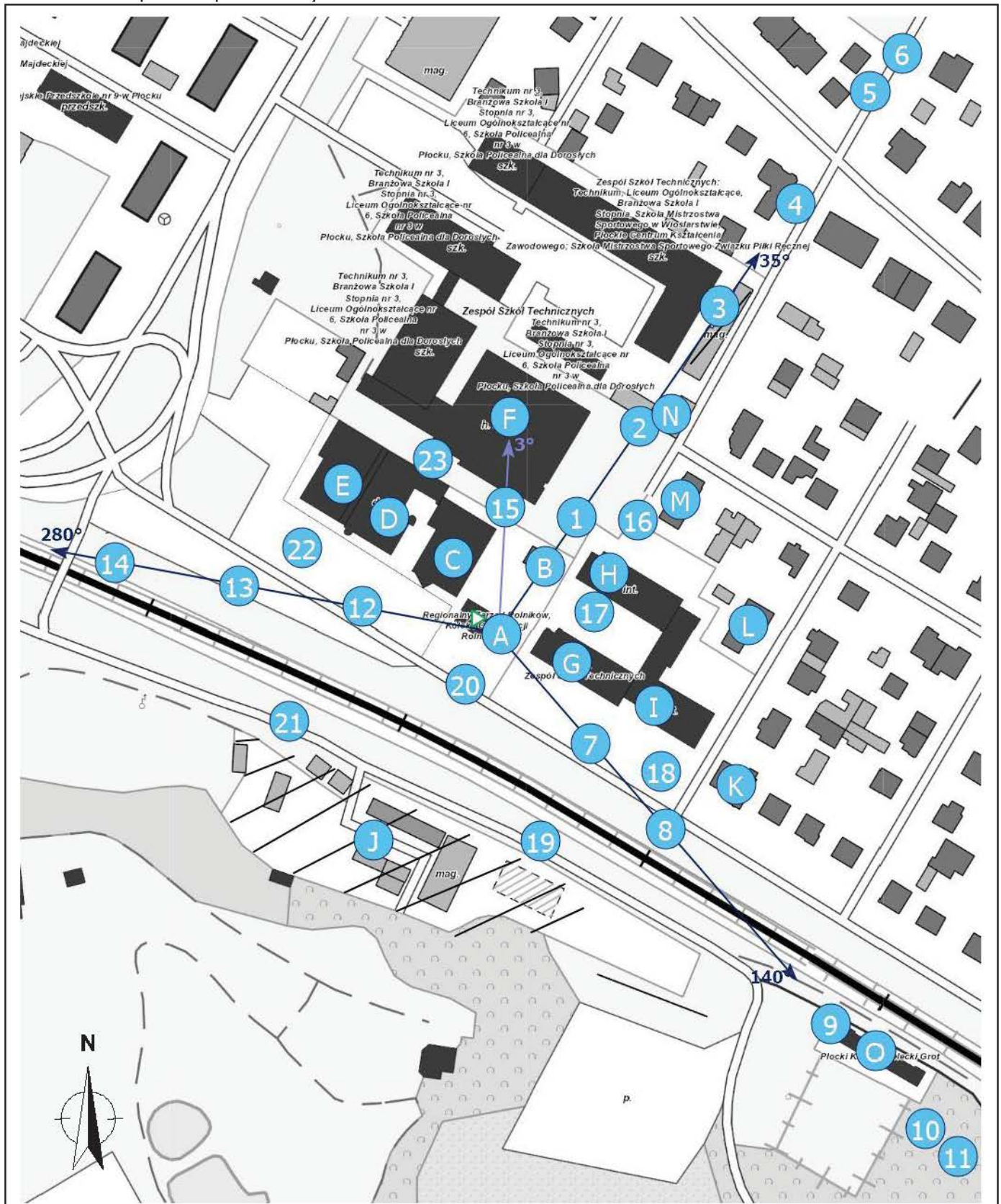
Zał. 2. Widok pionów pomiarowych